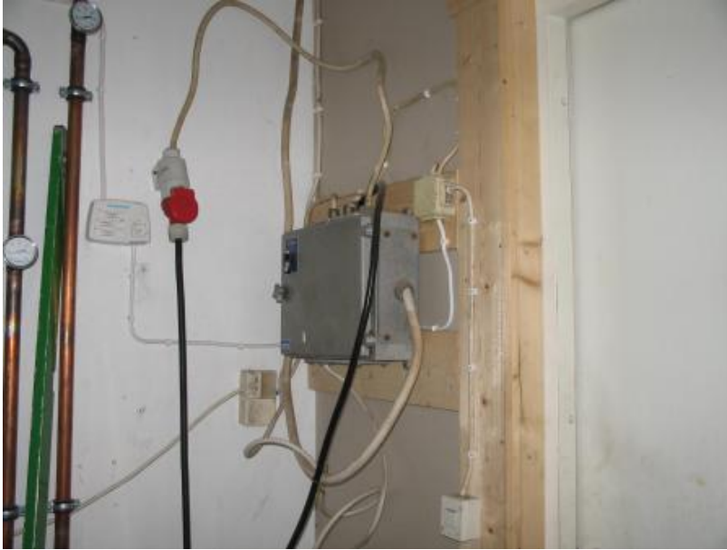
Kuva 4. Ala-arvoista asennustyötä muodollisesti pätevän ammattimiehen jäljiltä.

Katselmuksissa esille tulleen käyttöönottotarkastuspöytäkirjan puuttuminen aiheutti miltei poikkeuksetta hämmennystä, kun tuli esille että ilman vaadittavaa käyttöönottotarkastusta ei laitteistoa saa ottaa käyttöön koska sen turvallisuudesta ei muutoin saa varmuutta.