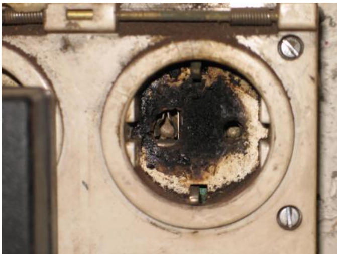
Kuva 2. Hiiltynyt pistorasian pohja.