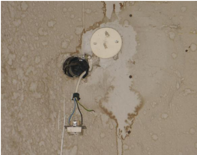
Kuva 1. Kiinnittämätön käytössä oleva pistorasia.

Käytössä olevia pistorasioita oli kiinnittämättä (kuva 1). Yhdellä tilalla pistorasia oli pahoin palanut löysän liitoksen johdosta. Pistorasian pohja oli pahoin hiiltynyt (kuva 2). Samoin kuivantilan jatkopistorasioita löytyi jopa kuivaamoista ja ne olivat täynnä pölyä. Katselmuksessa löytyi runsaasti pistorasioita joiden koteloituokitus ei perusrakenteen tai rikkoutumisen takia vastannut tilaluokitusta. Kuivan tilan jatkopistorasioita oli käytetty jopa ulkotiloissa.